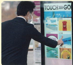
デジタル停留所 JR浪江駅、浪江町役場、 道の駅なみえに設置