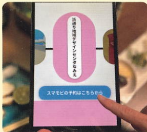
ミニデジタル停留所

※行った先から再度スマモビを利用したいときは、 付近に予約端末があることを確認してからお出かけください。 ※同一日複数回乗車割引は適用されません。